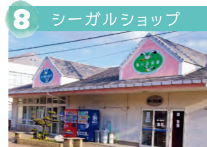
8 シーガルショップ 島で唯一のお店。売店と休憩所があり、お酒も飲める島民の憩いの場です。