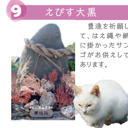
9 えびす大黒 豊漁を祈願して、はえ縄や網に掛かったサンゴがお供えしてあります。

島の主な産業は漁業で、はえ縄、刺網、定置網、採介藻漁業が行われています。島の周りは水産資源が豊富で、四季を通じて鯛、ヒラメ、イサキ、トラフグ、甘鯛、鯖などの高級魚をはじめ、アワビ、サザエ、ウニ、海藻が水揚げされています。