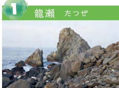
1 龍瀬 たつぜ 東に大きな岩、西に小さな岩があり、夫婦岩のようにも見えます。