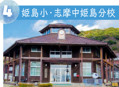
4 姫島小・志摩中姫島分校 木造のおしゃれな校舎。平成8年に現在地に移りました。