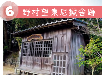
6 野村望東尼獄舎跡 幕末期、勤王の志士をかくまった罪で姫島へ流罪になった野村望東尼。簡素な獄舎で厳しい生活を強いられた彼女を、心優しい島民が助けた様子が当時の彼女の日記に残っています。後に、高杉晋作の命で救出され、防府(山口県)で余生を過ごしました。