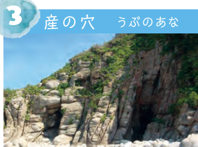
3 産の穴 うぶのあな 高さ約10mの二つの岩穴。島の子どもたちは「ウソの穴」と呼んでいます。島の神様が生まれた場所と伝わります。