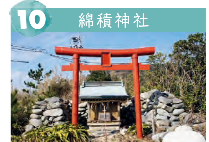
10 綿積神社 曾根崎の突端に祭られている海の神社。毎年5月10日に豊漁と船の安全を願って祭りが行われます。