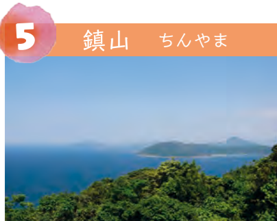
5 鎮山 ちんやま 標高186.7m。北東側の茶屋の大門をはじめ、玄界灘を一望できます。江戸時代には遠見番所が設置され異国警護の要所でした。昭和40年代までは貴重な農地として段々畑が築かれていましたが、その後荒廃。現在は、年2回地元の子どもと大人が参加し、登山道の整備を行っています。