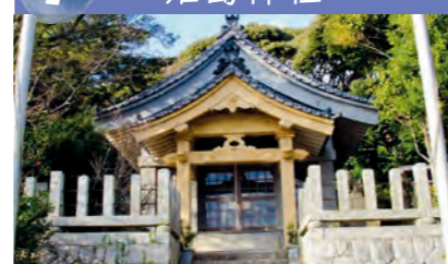
7 姫島神社 豊玉姫命、ウガヤフキアエズノミコトなどを祭ります。安産の神様です。