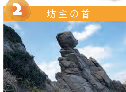
2 坊主の首 島の北端の崖の上にある奇岩。お坊さんの頭に見えます。落ちそうで落ちない。受験生におススメ!!